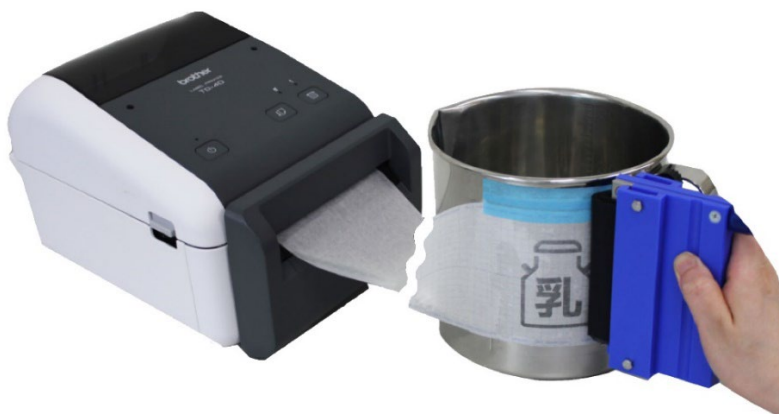
「専用サーマルプリンター」と新型「ステンシルテープ-S」 マーキングイメージ

「卵」「手」などの図形をマーキングすることで、アレルギー混入防止につながります。このように新発売の「ステンシルテープ-S」はマーキングの用途の拡大と作業性の向上に貢献します。